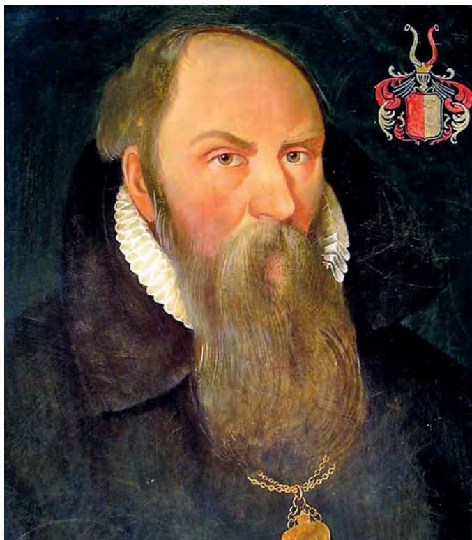
Heinrich Rantzau wurde am 11.03.1526 geboren

Unser Jubilar wäre – er lebt nicht mehr – vor rund neun Wochen 500 Jahre alt geworden und war von Geburt an zu Großem bestimmt. Deswegen ließ sein Vater ihm das Horoskop stellen und bezifferte diese auf den 11.03.1526 eine Stunde 49 Minuten und 34 Sekunden vor Mitternacht. Auch wurde der Junge so früh auf die Wittenberger Universität geschickt, dass er noch ein paar von Luthers Tischreden mitbekam. Ob sie mehr nützten als schaden, wird man nie wissen, denn Heinrich Rantzau wurde nicht zum Theologen ausgebildet, sondern zum Höfling und Staatsmann, und kam zu diesem Zweck 1547/48 mit seinem Landesfürsten an den Hof Kaiser Karls V., wo man feststellte, daß sein jüngerer Vetter Daniel eher zum Kriegsmann taugte, Heinrich jedoch zur umfassenden humanistischen Bildung. So pflegte er sein schon vorher