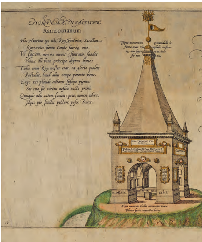
Die aus Gips errichtete Pyramide von Segeberg

Interessanter wird betont, man sei hier den römischen Pyramiden gleichwertig, obwohl weder aus Stein noch Holz noch Bronze. Tatsächlich nahm Rantzau dazu den Gips vom Segeberg, und trotz Stiftungsfonds zum Bauunterhalt erwies sich das als grober lokalpatriotischer Schnitzer: Schon 40 Jahre später war das Ding – wie manches sonst in der Welt – total abgesandet. Sic transit gloria.